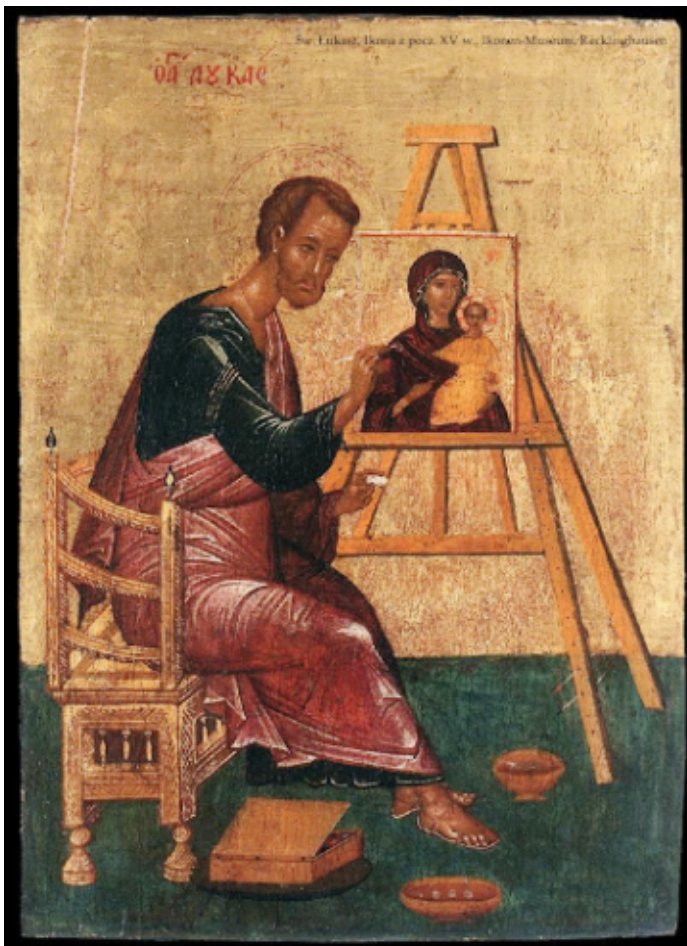
Św. Łukasz maluje Madonnę, ikona z pocz. XVw., Muzeum Ikon Recklinghausen